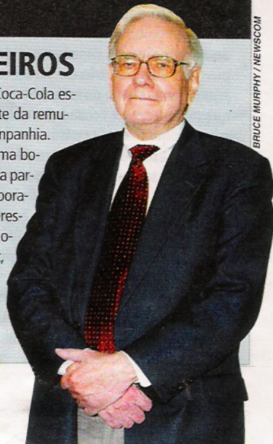
Buffett: entusiasmo com mudança na Coca

Uma recente decisão do conselho de administração da Coca-Cola está provocando polêmica. A empresa vai condicionar parte da remuneração dos conselheiros à valorização das ações da companhia. Se as ações subirem mais de 8% ao ano, eles recebem uma bônus após três anos. Caso contrário, ficam apenas com uma parte da remuneração fixa. Especialistas em governança corporativa alegam que a medida pode provocar conflito de interesses. Os conselheiros poderiam ser menos cuidadosos na hora de auditar os resultados das empresas. Warren Buffett, maior acionista individual da Coca-Cola, é um dos entusiastas da mudança. Ele está deixando o posto de conselheiro da companhia.