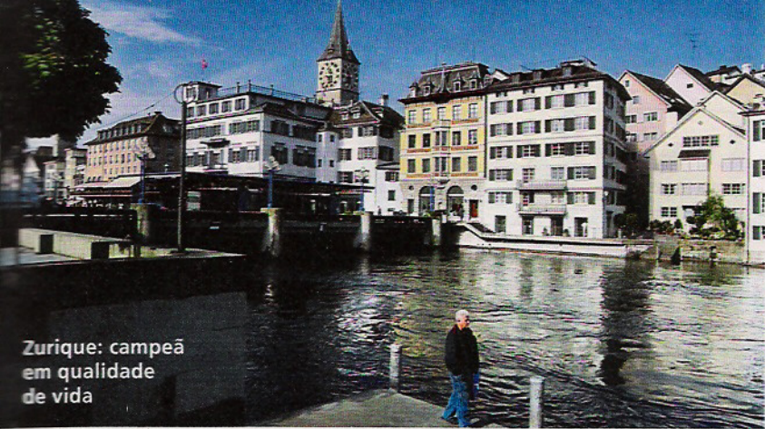
Zurique: campeã em qualidade de vida